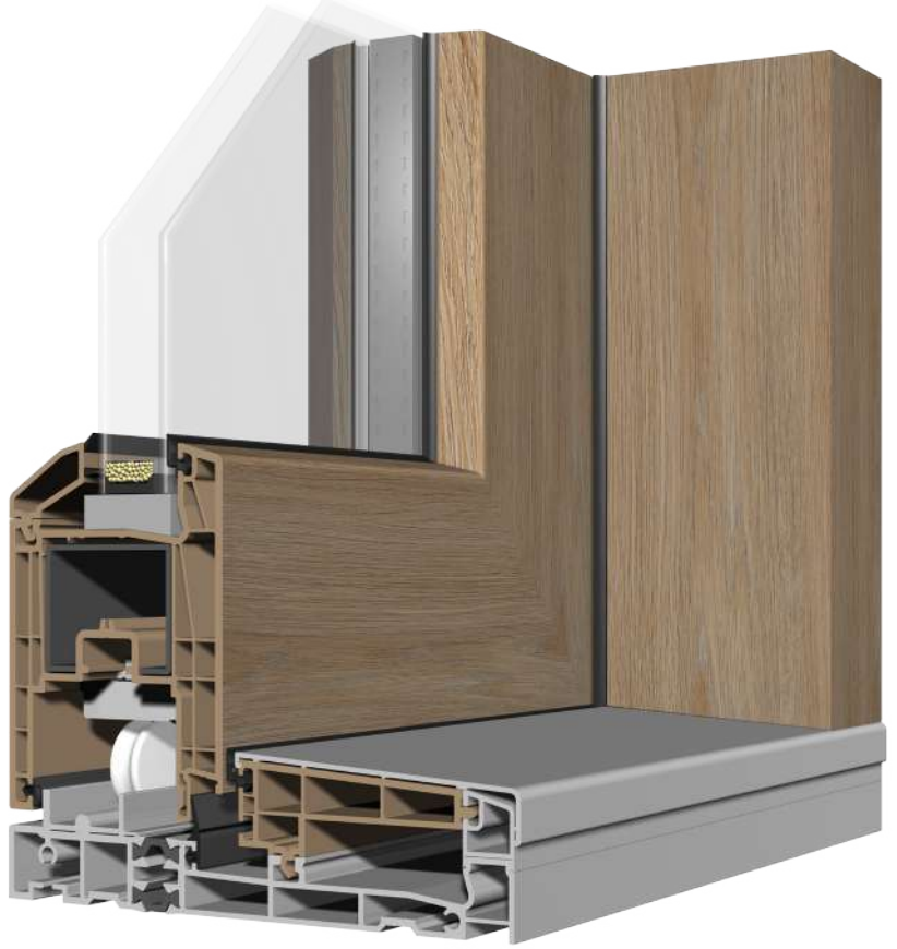
PRIME Sliding Kapı Detayı (Alüminyum Eşikli)